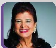
LUIZA HELENA TRAJANO Conselheira Magazine Luiza e Presidente do Grupo Mulheres do Brasil

CONEXÃO ENTRE ESG, DIVERSIDADE & INCLUSÃO E ODS OBJETIVOS DE DESENVOLVIMENTO